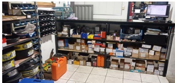
Figura 7 – Estoque parcial da oficina

Os respondentes pontuaram que trabalham com um estoque de giro rápido, sobretudo para os serviços mais constantes como a troca de óleo, filtro, pastilha de freio e outros componentes simples. Em relação à chegada das peças na oficina, existe uma variação entre 40 minutos (algo simples e de fácil acesso) até o período de 3-4 dias para chegar, cujo tempo independe da oficina. Mas, diante de toda essa dinâmica, asseguraram que a oficina possui uma gestão de estoque. A Figura 7 apresenta o estoque parcial da oficina.