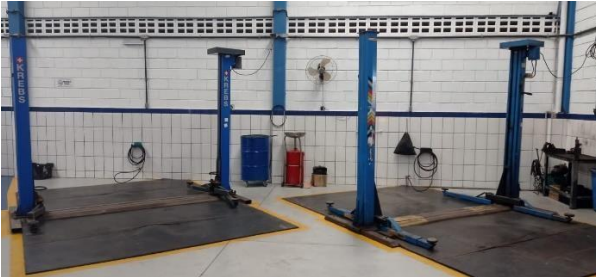
Figura 4 – Box produtivo

Sobre o layout da empresa, os respondentes afirmaram que se trata de algo novo na oficina, o qual tem se apresentado muito eficiente, sobretudo tendo em vista a subdivisão do espaço de trabalho em “ boxes ”, produtivos e não produtivos (Figuras 4 e 5), totalmente demarcados e organizados, onde existe uma sequência lógica e racional para a execução dos serviços considerando a ordem adequada capaz de manter agilidade e qualidade nos atendimentos.