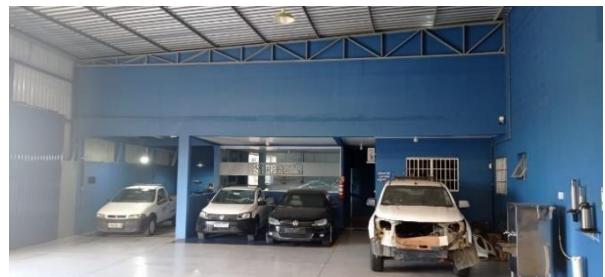
Figura 5 - Box improdutivo