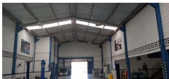
Figura 2 – Vista interna da oficina

A oficina está inserida no mercado há 20 anos, e trata-se de um ramo de consertos mecânicos de linha leve, utilitários, injeção eletrônica, alinhamento e balanceamento 3D, oxi-sanitização, desempenho de rodas, entre outros. Nos primeiros anos, a oficina estava situada em um salão comercial alugado, e há 15 anos ocupa um imóvel próprio com cerca de 1.200 m 2 . A Figura 2 demonstra a parte interna da oficina.